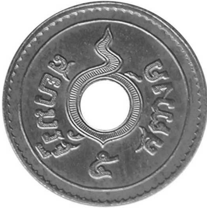
ZIE PAG. 178