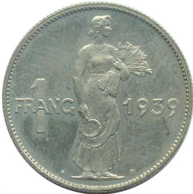
ZIE PAG. 95