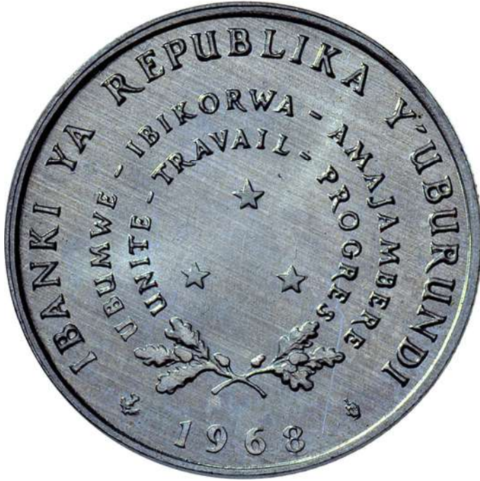
ZIE PAG. 36