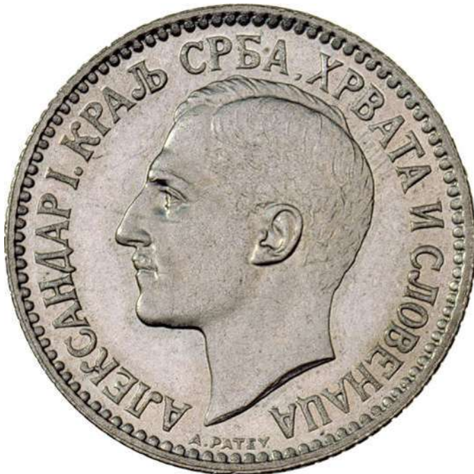
ZIE PAG. 71