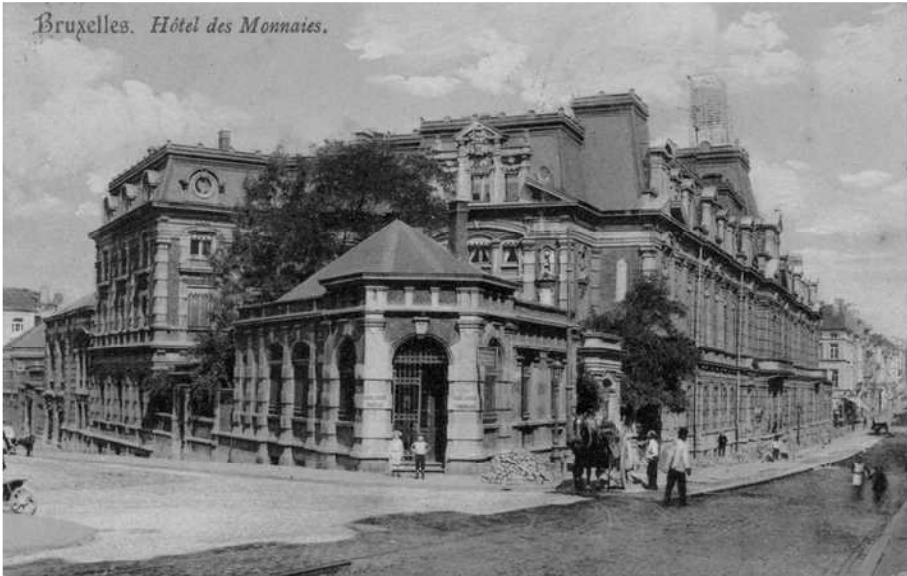
Het Munthof in Sint-Gillis (Brussel) omstreeks 1900