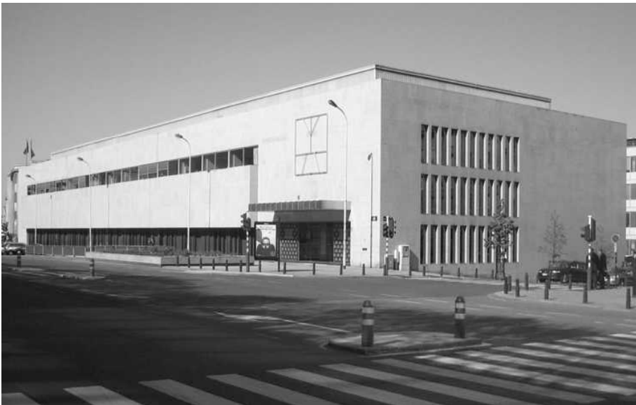
De huidige Koninklijke Munt van België (Pachecolaan in Brussel)