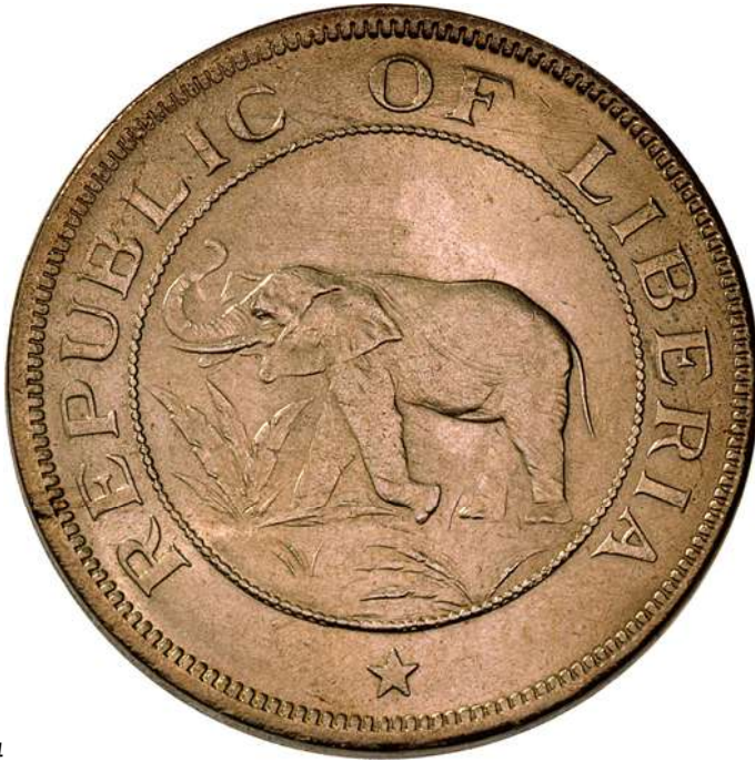
ZIE PAG. 74