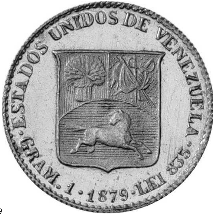
ZIE PAG. 189