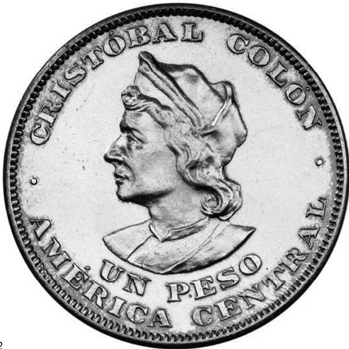
ZIE PAG. 172