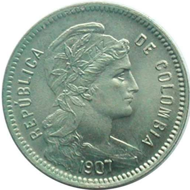
ZIE PAG. 40