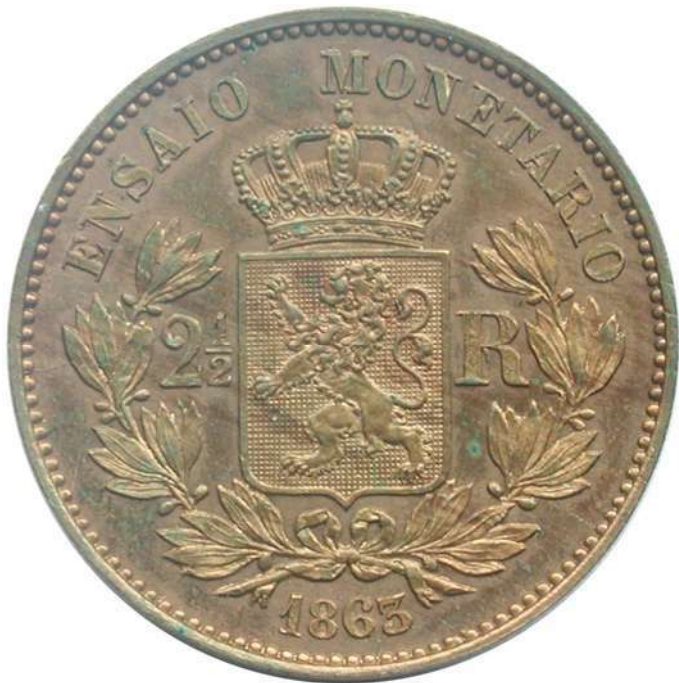
ZIE PAG. 202