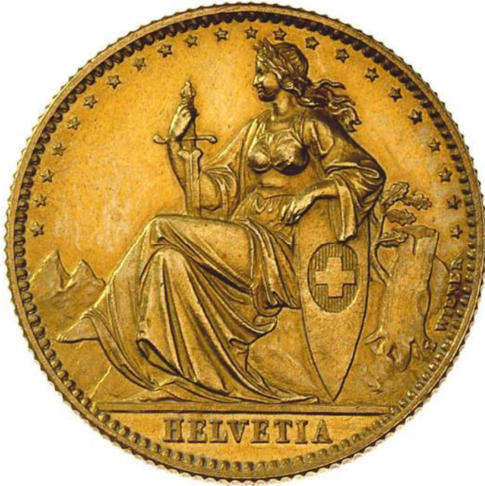
ZIE PAG. 195