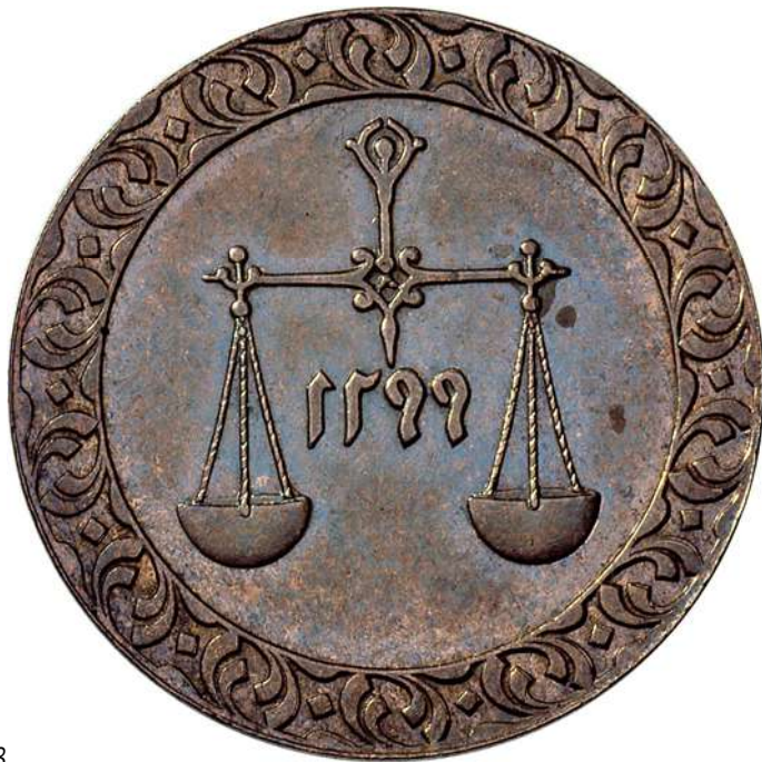
ZIE PAG. 193