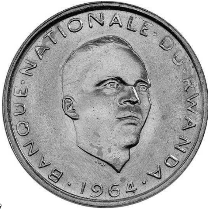
ZIE PAG. 169