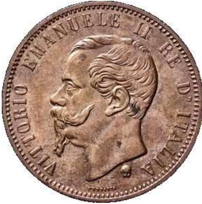
ZIE PAG. 68