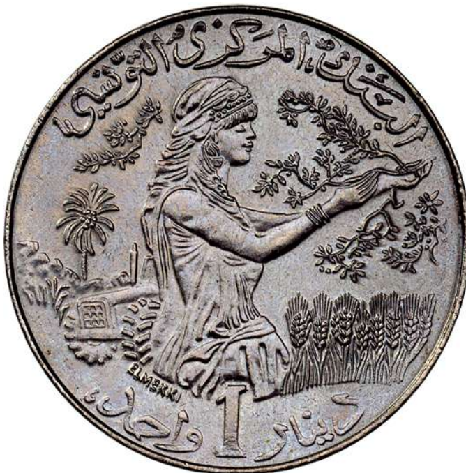
ZIE PAG. 186